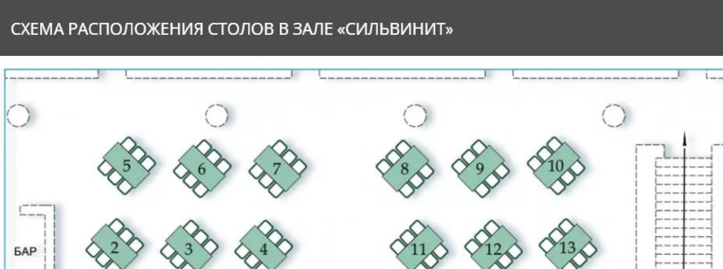
СХЕМА РАСПОЛОЖЕНИЯ СТОЛОВ В ЗАЛЕ «СИЛЬВИНИТ»

Детям от 3 до 5 лет включительно, без предоставления посадочного места входной билет на Новогодний банкет предоставляется бесплатно.